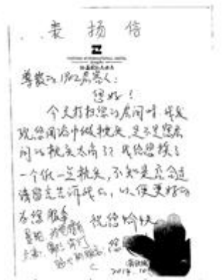
(以上由通讯员段梦君供稿)