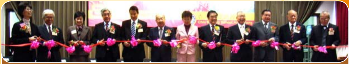
本會所屬潮商學校舉行建校八十五周年慶祝活動