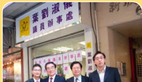
葉劉淑儀議員港島西辦事處開幕，許學之會長(左二)前往致賀。