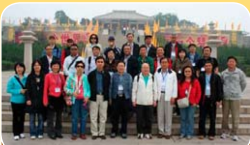
香港工商社團秘書考察團赴陝北延安參觀，中聯辦周志榮副部長為榮譽顧問、本會林楓林秘書長任團長。