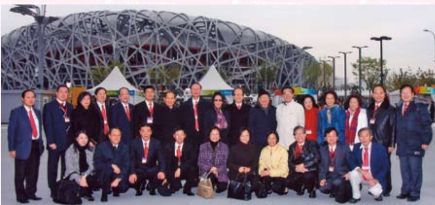
參觀北京奧運主場館——鳥巢