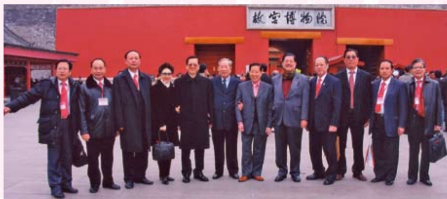
出席故宮博物院舉行的「陶鑄古今——饒宗頤學術藝術展」