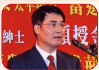
中聯辦黃蘭發副主任