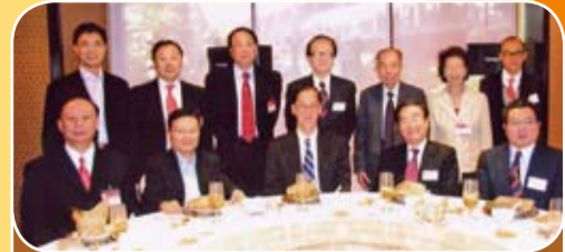
民政事務局曾德成局長(前中)會晤香港潮屬社團總會，以及香港潮州商會、香港九龍潮州公會首長