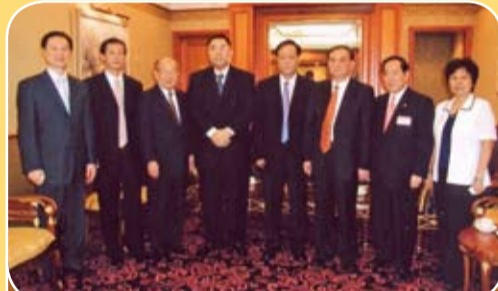
陳偉南等出席澳門潮州同鄉會，澳門潮汕總商會慶典，和澳門中聯辦副主任李本鈞(右四)等合影