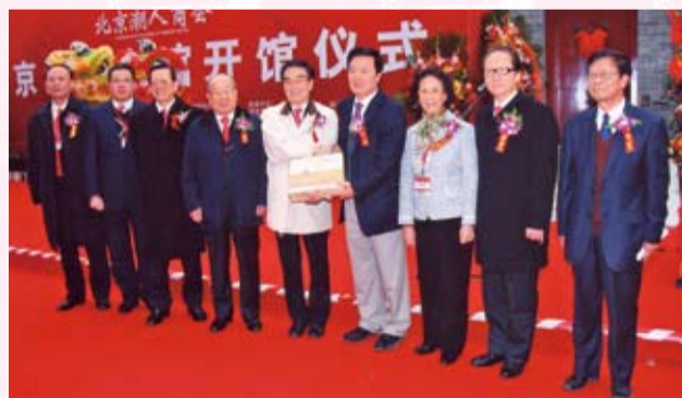
訪問團與北京潮人商會互贈紀念品