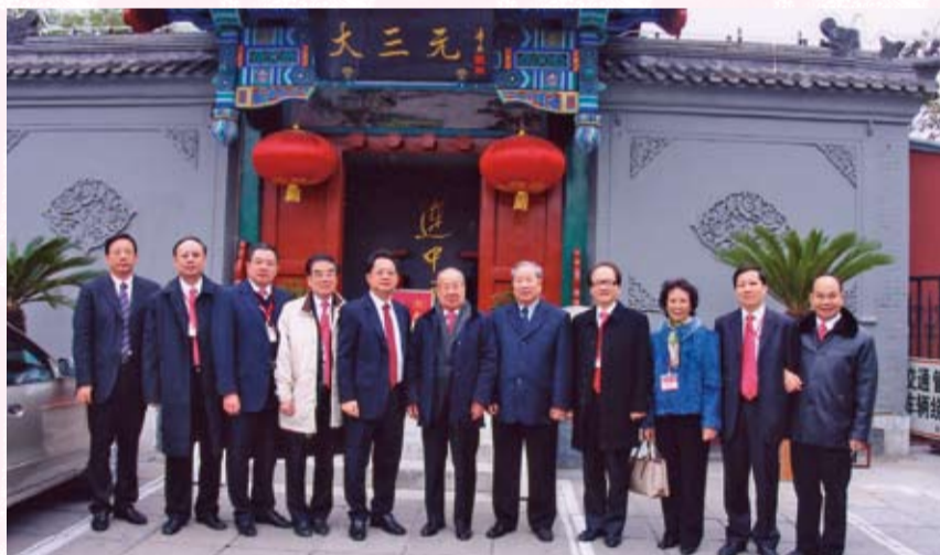
出席香港大學在大三元酒家舉行的歡迎宴會