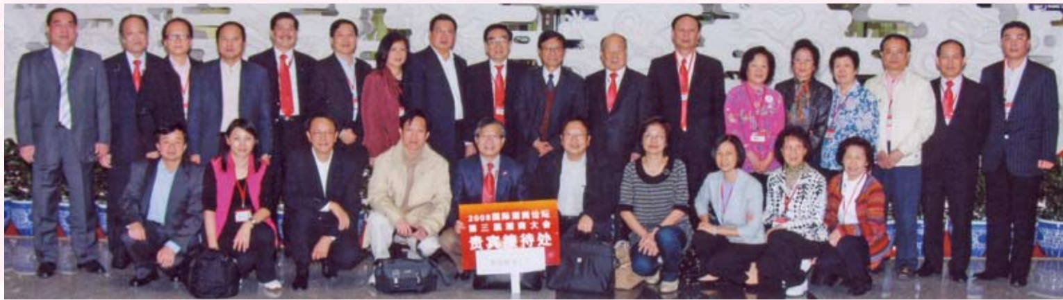
抵達北京國際機場