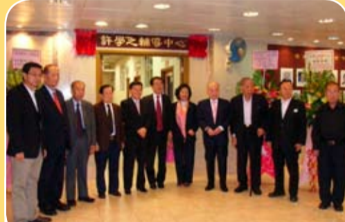
港九潮州公會中學許學之輔導中心開幕