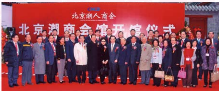
參加北京潮商會館開館儀式