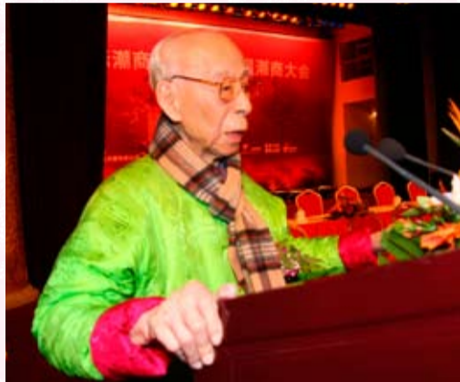
饒宗頤教授在國際潮商論壇上致辭