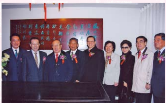
於北京潮商會館合影