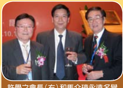
許學之會長(右)和馬介璋永遠名譽會長出席雲南僑商會成立大會，中為雲南省省長秦光榮。