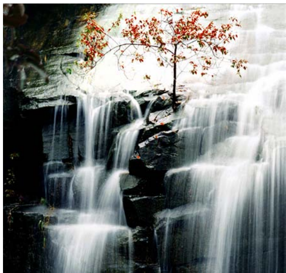
◇ 海丰莲花山——空山秋韵（摄于2002年9月）