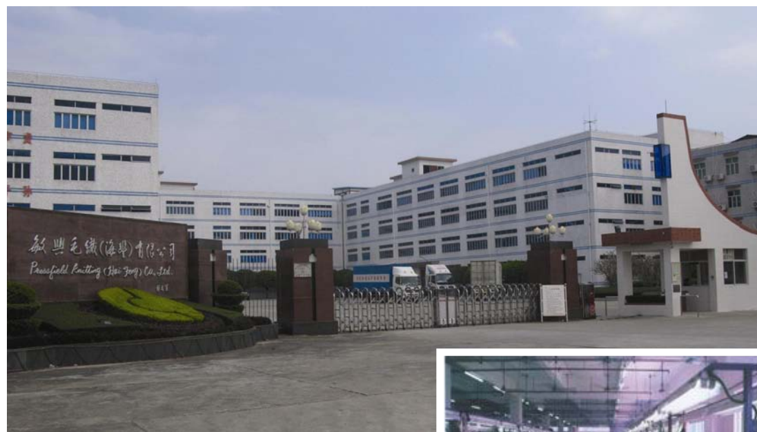
◇ 位于城东镇的敏兴毛织厂（摄于2004年8月）