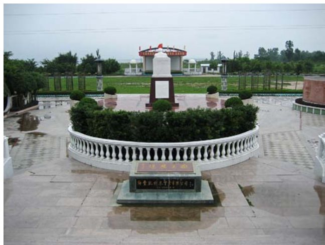
◇ 公平敬文广场(摄于2002年1月)