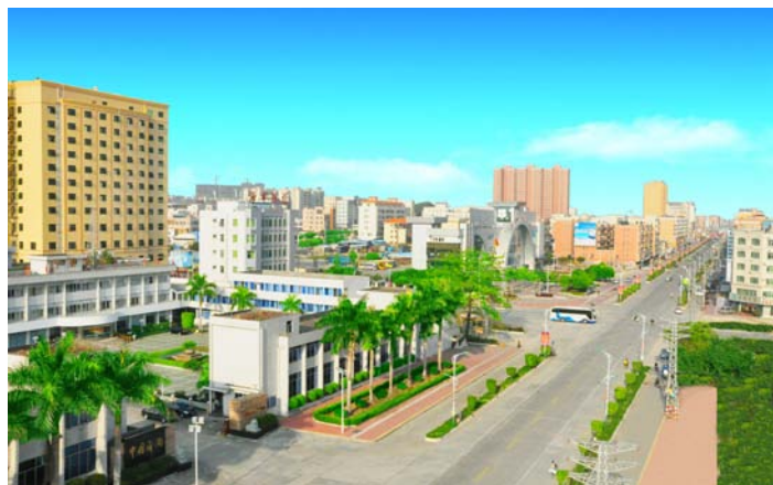
◇ 海丰县城一角（摄于2010年10月）