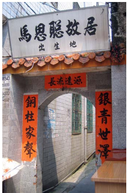
◇ 马思聪故居(摄于2002年9月)