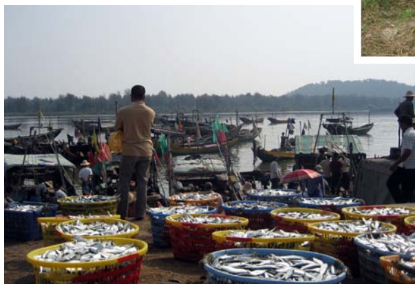
◇ 小漠渔码头 (摄于 2004 年 10 月)