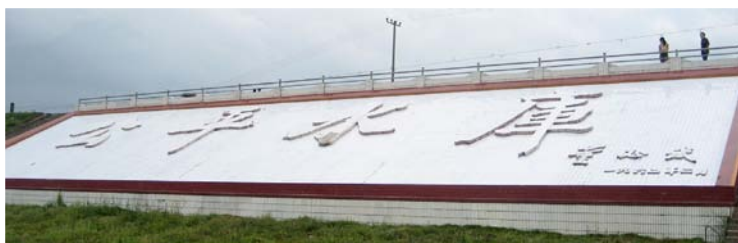
◇ 公平水库（摄于2003年9月）