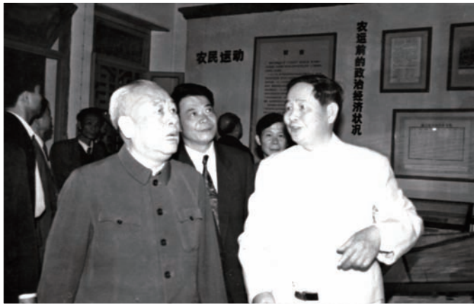
◇ 1993年1月10日，原国务院副总理余秋里（左）在红官纪念馆听海丰农运史介绍。