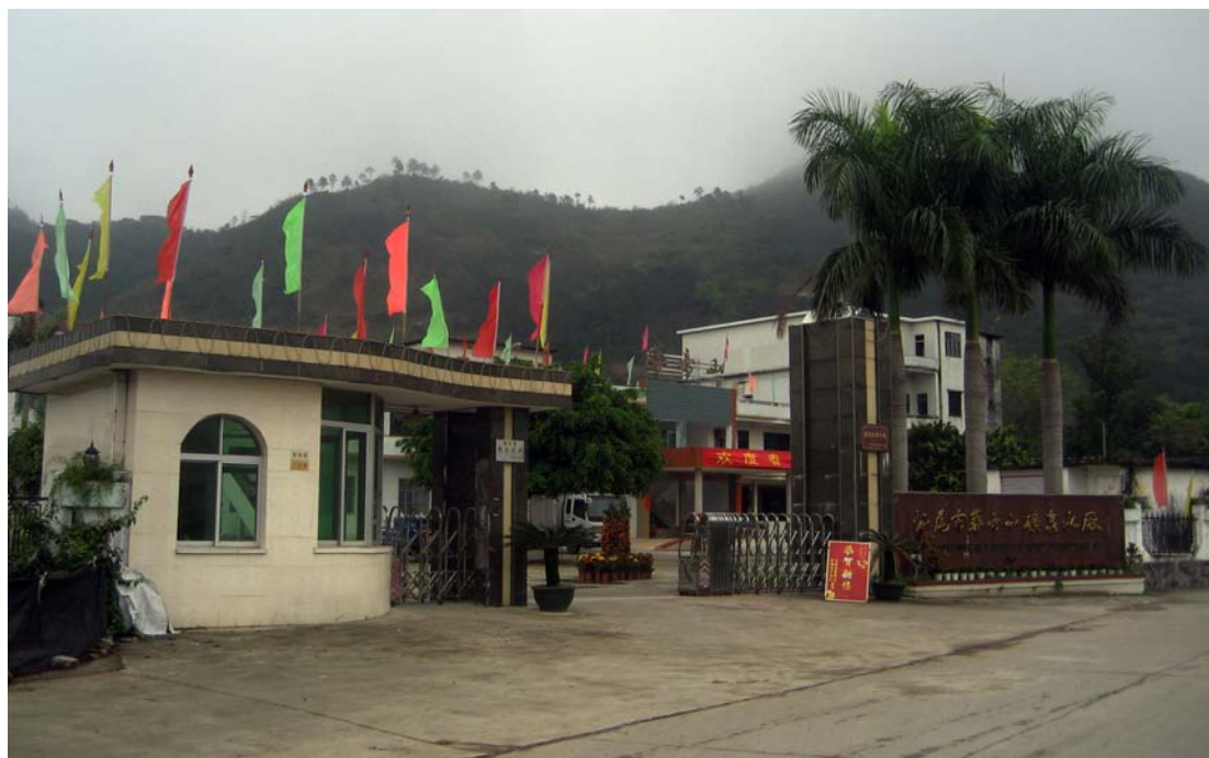
◇ 位于梅陇镇的华帝山矿泉水厂（摄于2002年8月）