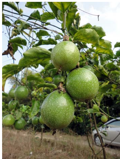
◇ 赤石西番莲 (摄于 2004 年 11 月)