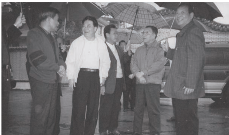
◇ 1999年12月18日，原广东省委书记吴南生（右二）到公平水库考察工作。