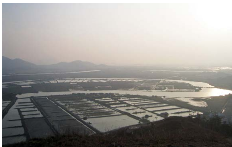
◇ 丽江春色 (摄于 2004 年 3 月)