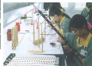
◇ 位于可塘镇的雅天妮首饰厂（摄于2004年8月）