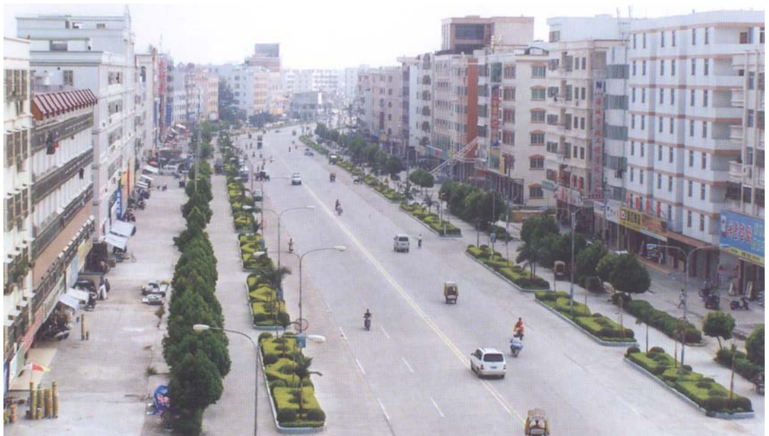
◇ 城东镇区一角（摄于2004年8月）