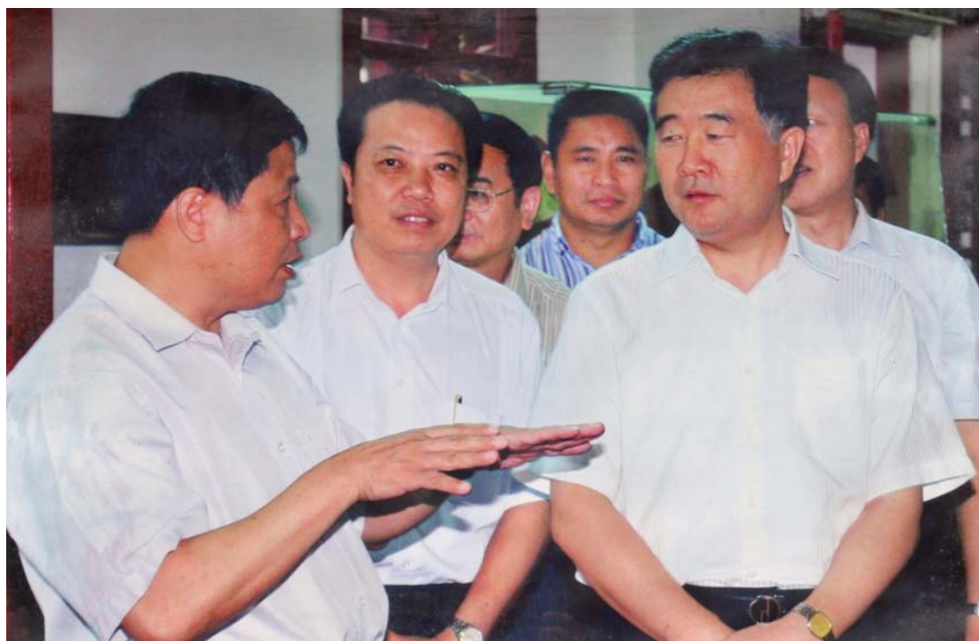
◇ 2008年8月5日，中共中央政治局委员、广东省委书记汪洋（右一）在汕尾市委书记戎铁文（左一）、海丰县委副书记、县长郑佳（左二）陪同下深入海丰调研。