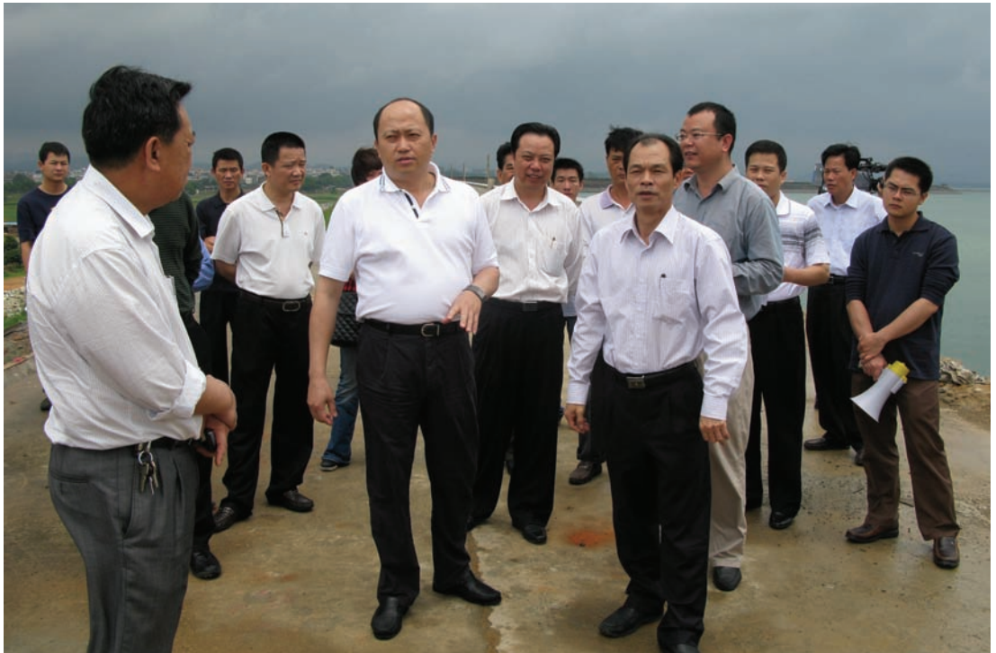
◇ 2010年4月22日，汕尾市长郑雁雄（前左二）、副市长骆金堤（前左四）、海丰县委书记郑佳（前左三）到公平水库检查除险加固工程建设情况及防汛工作。