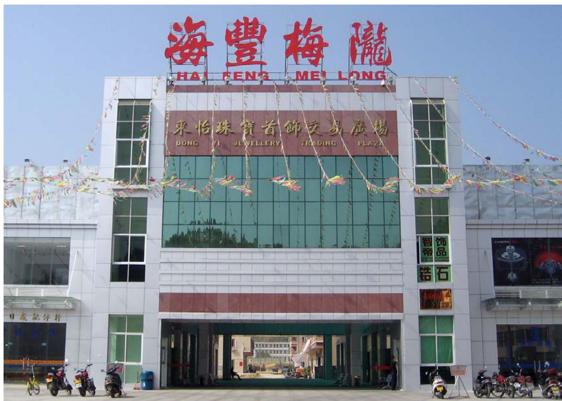
◇ 东怡珠宝首饰交易广场（摄于2007年12月）