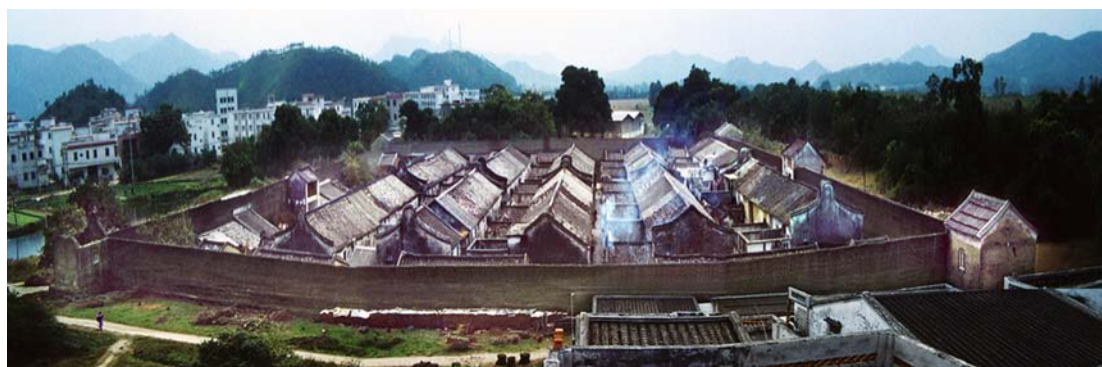
◇ 赤石镇林厝寨全貌（摄于2003年）