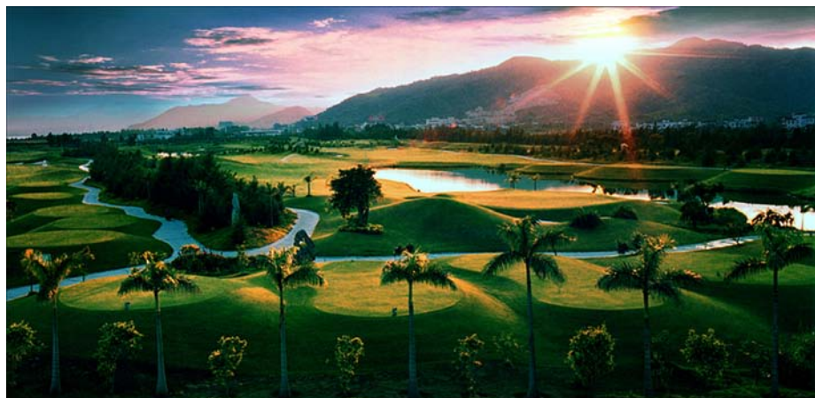
◇ 鲒门海丽国际高尔夫球场（摄于2001年4月）