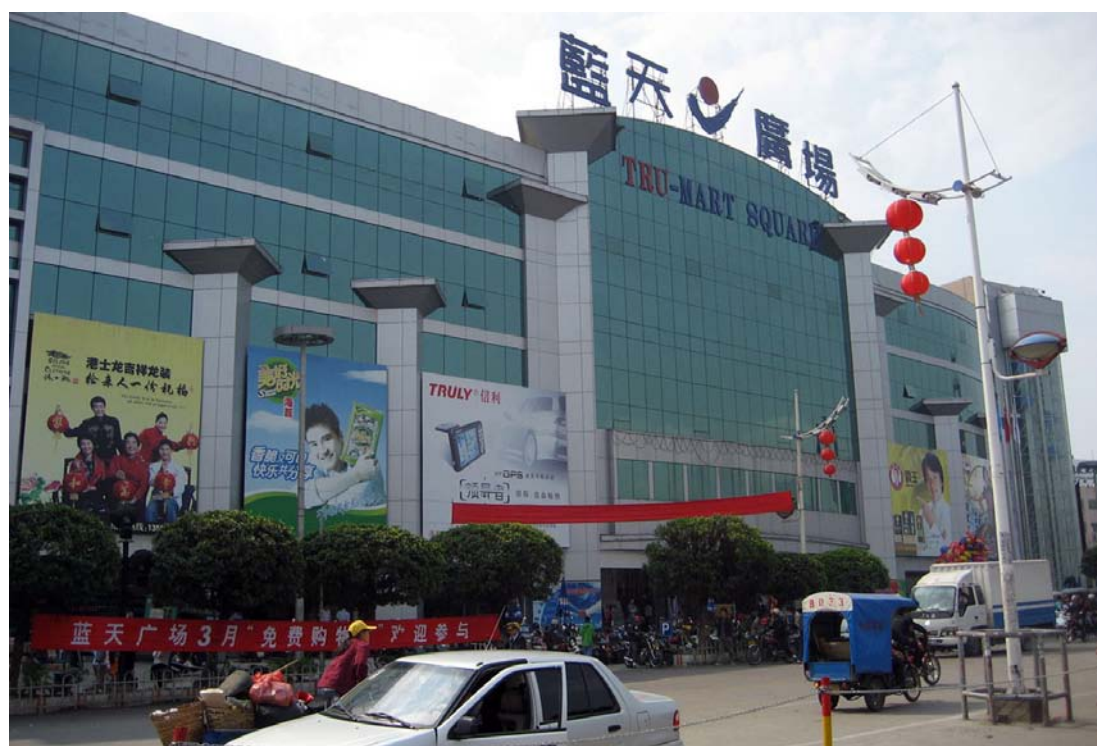
◇ 蓝天广场（摄于2003年3月）