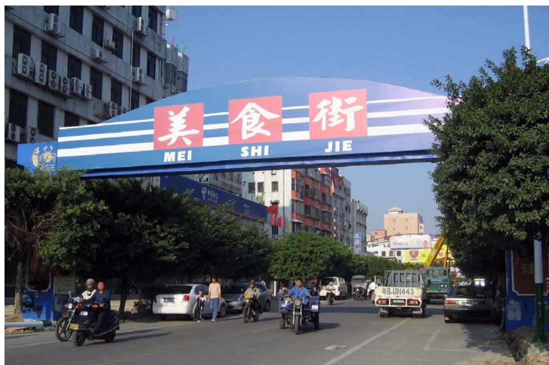
◇ 海城镇美食街（摄于2004年8月）