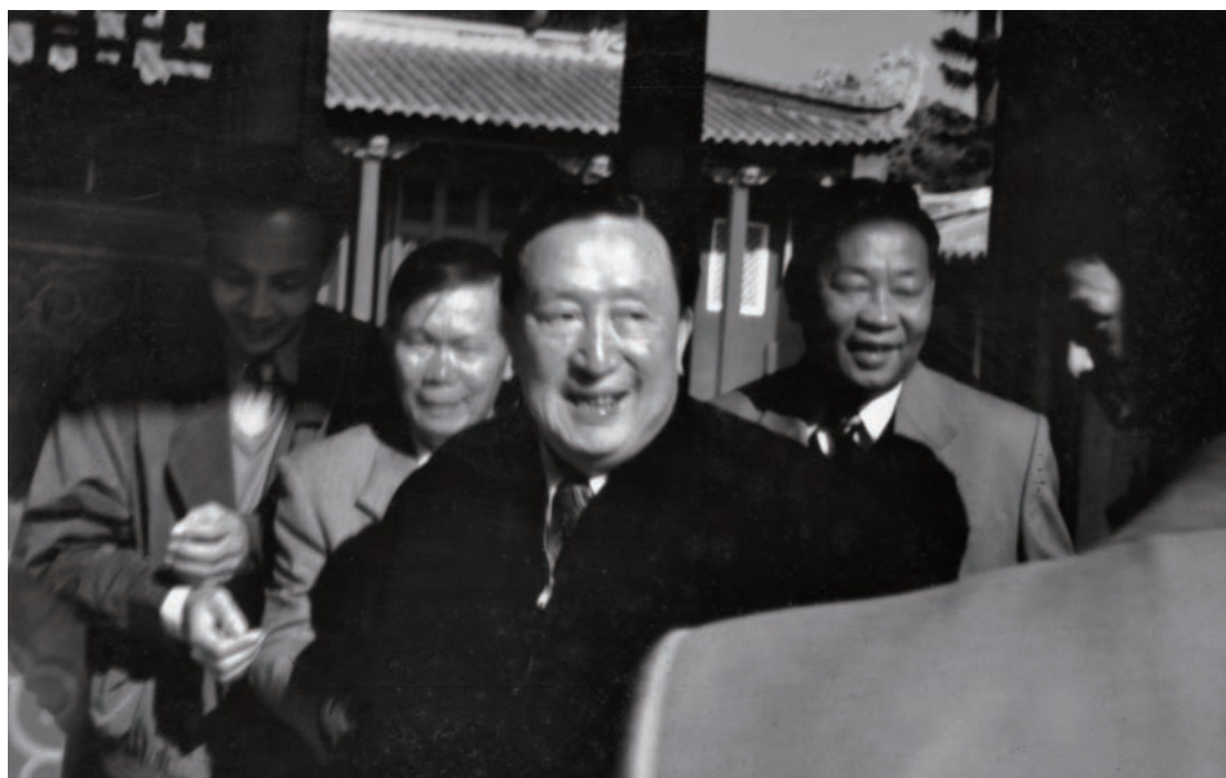
◇ 1996年春，全国人大常委会副委员长吴阶平（中）在市、县领导陪同下参观红宫。