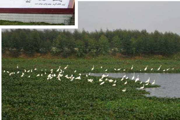
◇ 丽江水鸟（摄于2004年10月）