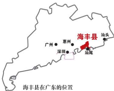
海丰县在广东的位置