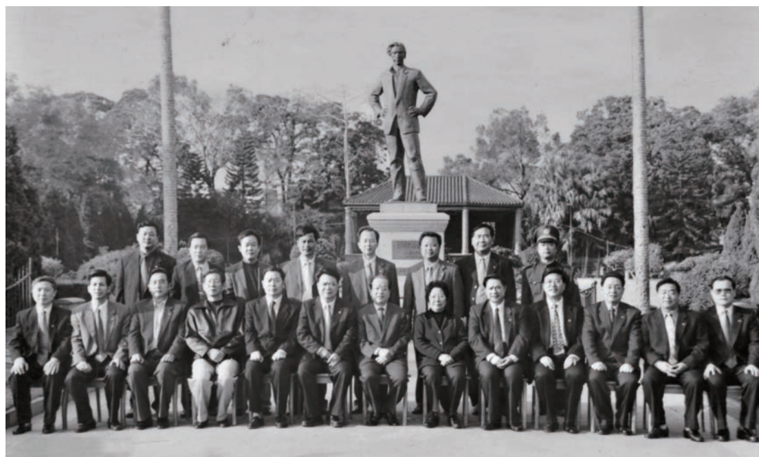
◇ 2000年1月15日，中共中央政治局委员、国务院副总理钱其琛在副省长许德立陪同下到海丰考察，图为钱其琛副总理（前排中）在红官红场与汕尾市、海丰县领导合影。