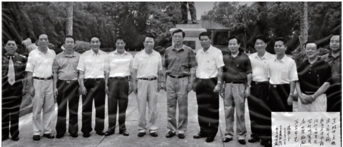
◇ 2003年6月5日，中共中央政治局委员、广东省委书记张德江（中），省委副书记欧广源（右六），省委常委、秘书长蔡东士（右五）等领导在汕尾市和海丰县领导的陪同下，到海丰县调研考察。