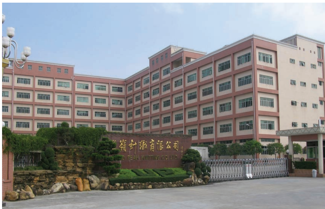
◇ 联岭毛织厂（摄于2004年8月）