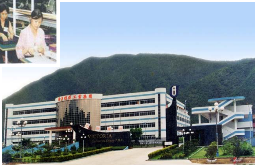
◇ 位于梅陇镇的维多利亚集团公司（摄于2004年8月）