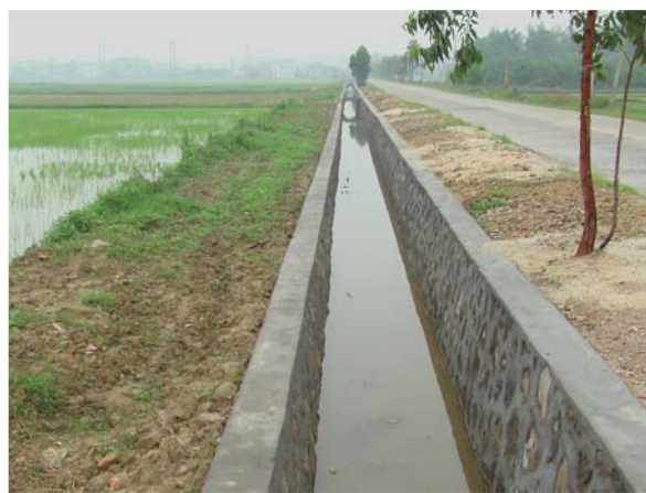
◇ 农田整治工程 (摄于 2004 年 4 月)