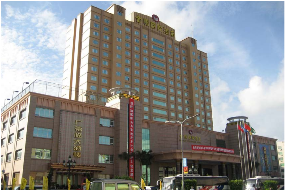
◇ 海丰金鹏国际酒店（摄于2007年6月）