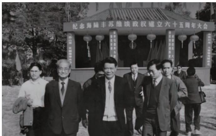
◇ 1992年11月28日，原中共中央政治局常委宋平（左二）在县委书记吴华南（右二）陪同下参观红官红场。