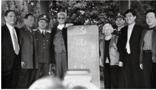
◇ 2000年12月6日，中央军委原副主席张震上将（左四）在红二师纪念碑同县委、县政府领导合影。