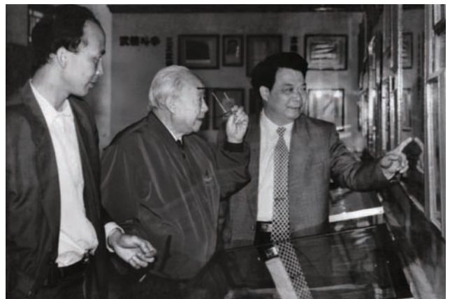
◇ 1997年3月20日，全国政协副主席钱伟长（中）在汕尾市委书记吴华南（右一）陪同下参观红宫纪念馆。