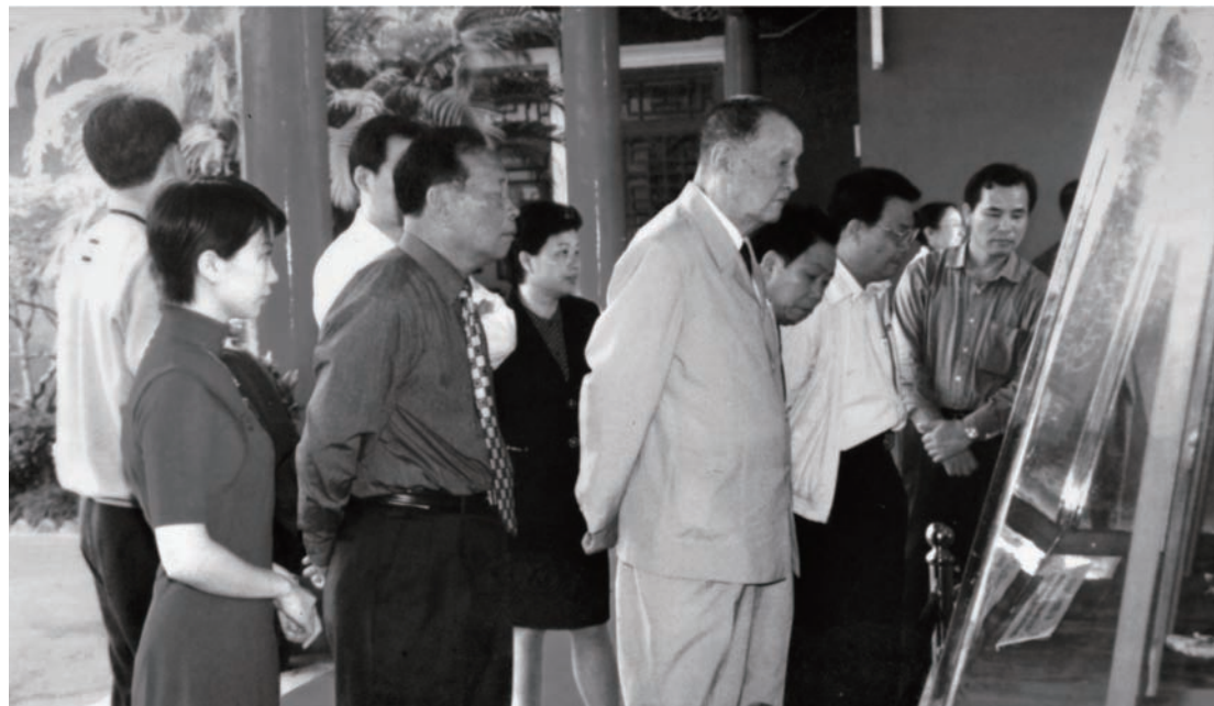
◇ 2000年11月29日，全国政协副主席洪学智（左三）在汕尾市委书记吴华南（右二）、海丰县委书记罗校（左二）等陪同下到红官红场参观。