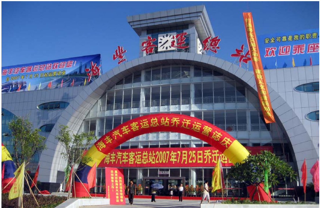
◇ 海丰客运总站（摄于2007年7月）