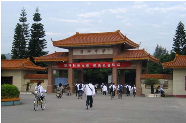
◇ 彭湃中学（摄于2004年9月）