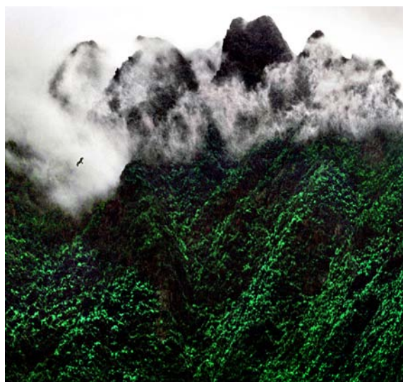
◇ 海丰莲花山——莲花魂（摄于2003年5月）