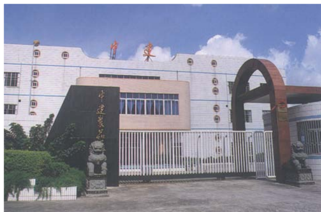
◇ 位于城东镇的中建金属制品厂（摄于2004年8月）