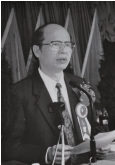
◇ 1996年10月22日，中共中央政治局委员、广东省委书记谢非在纪念彭湃烈士诞辰100周年大会上讲话。