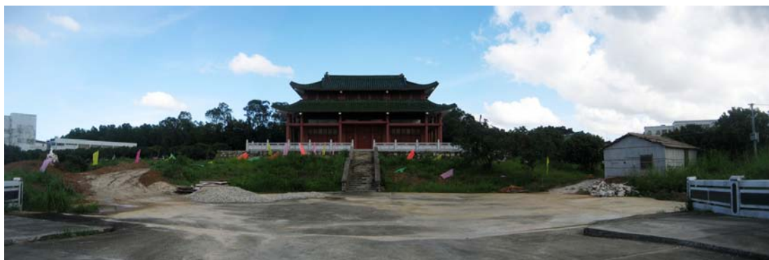
◇ 文天祥公园 (摄于 2004 年 10 月)