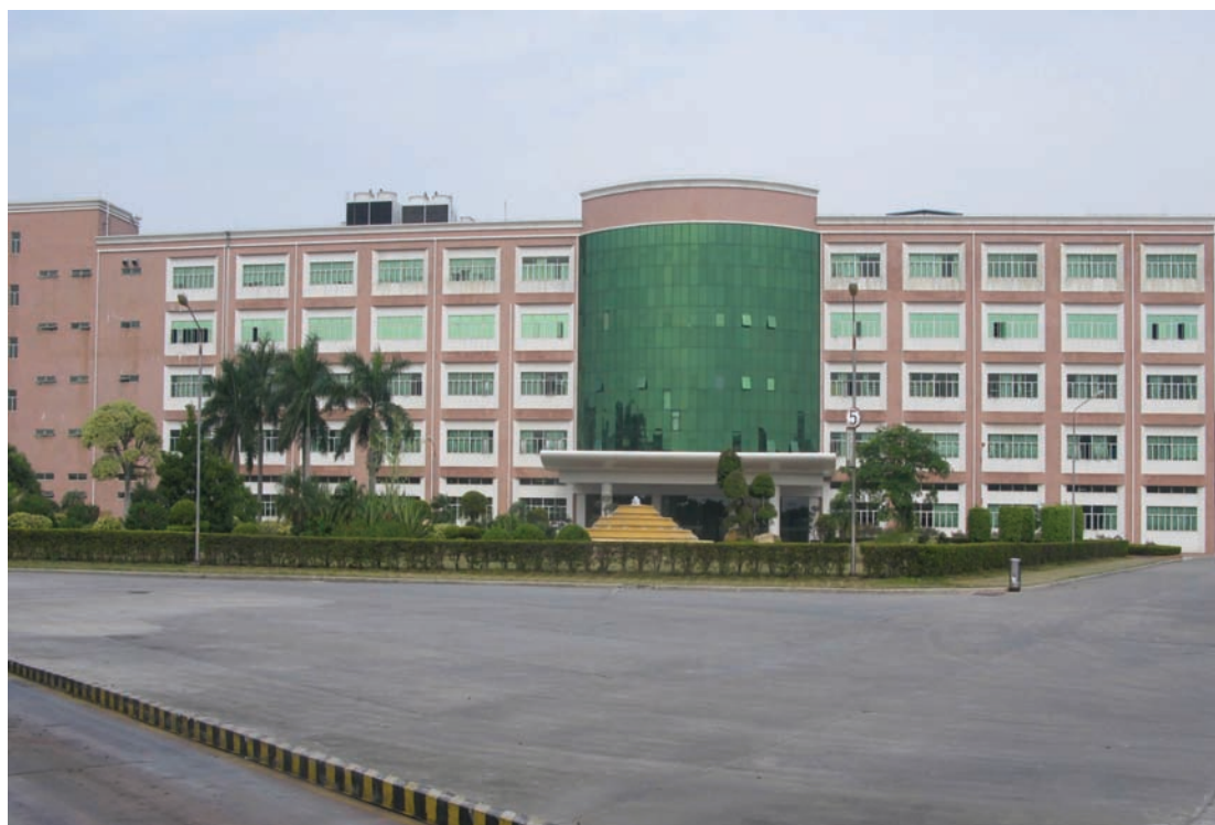
◇ 纬兴毛织厂（摄于2004年8月）