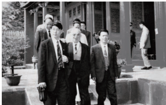
◇ 1993年1月8日，全国人大常委会副委员长廖汉生（前排中）参观红官红场。