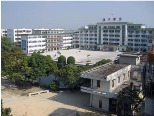
◇ 海丰中学（摄于2008年9月）