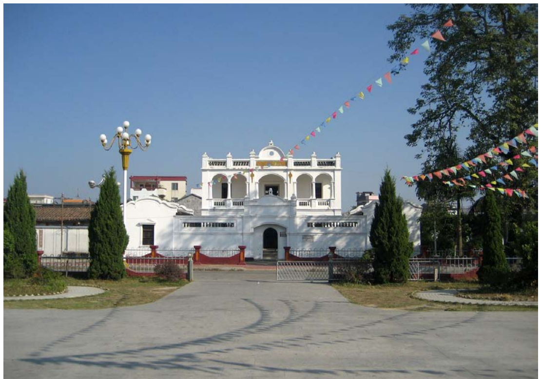
◇ 彭湃故居(摄于2006年10月)