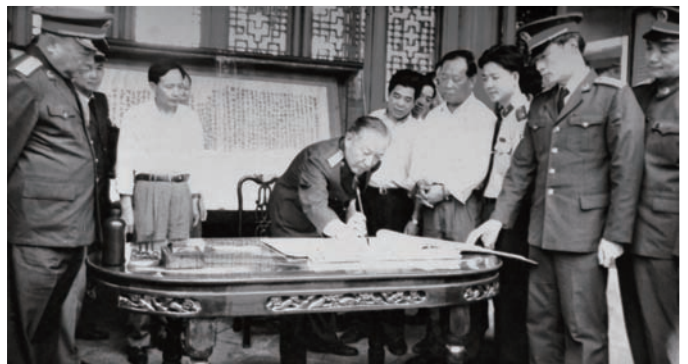
◇ 1995年4月18日，中央军委副主席、国防部部长迟浩田（题词者）参观红官红场旧址纪念馆并题词。