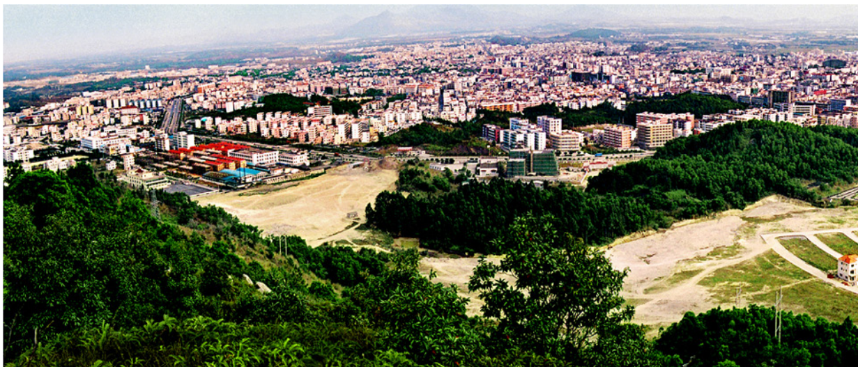
◇ 县城全貌（摄于2010年10月）