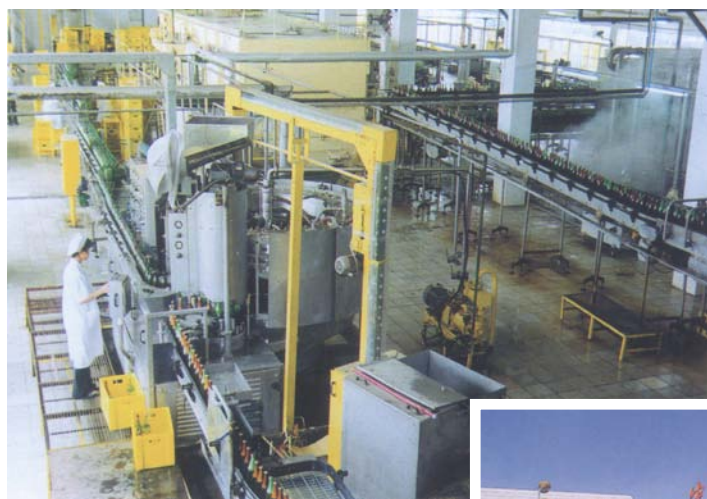
◇ 位于城东镇的珠江啤酒海丰分装厂的现代化流水生产线（摄于2004年8月）