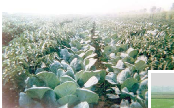
◇ 梅陇蔬菜基地 (摄于 2002 年 10 月)