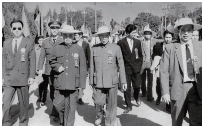
◇ 1992年11月18日，萧克将军（前排左二）代表中共中央参加纪念海陆丰苏维埃政权成立65周年大会。