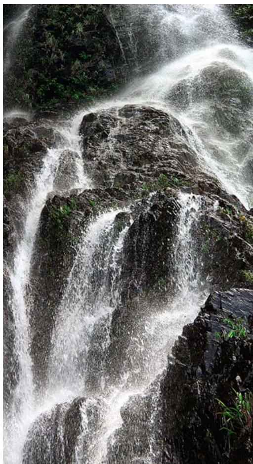
◇ 海丰莲花山——银瓶瀑布（摄于2003年5月）