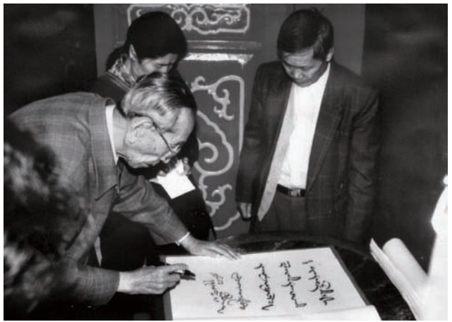
◇ 1997年1月21日，全国人大常委会副委员长阿沛·阿旺普美（题词者）参观红宫红场并题词：彭湃精神代代传。