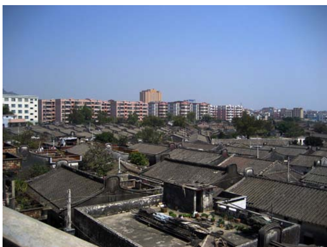
◇ 附城镇粉围村 (摄于 2004 年 3 月)