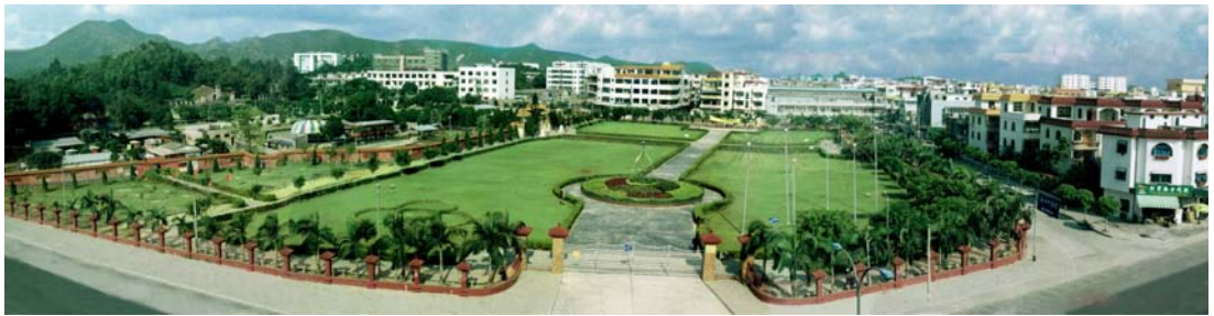
◇ 海丰县烈士陵园广场（摄于2010年10月）