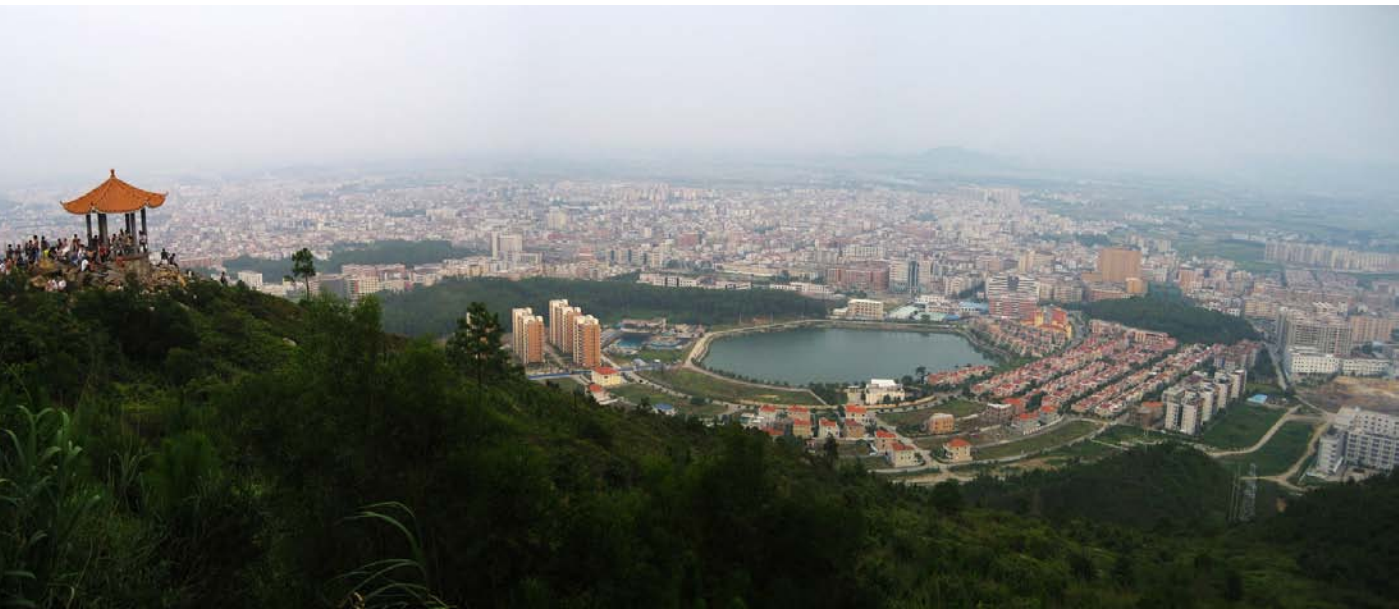
◇ 县城一角（摄于2010年10月）