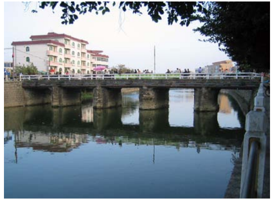
◇ 龙津古桥（摄于2009年10月）