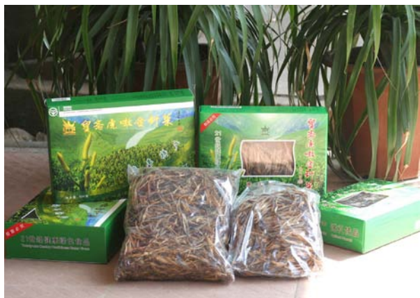
◇ 黄羌绿色食品黄花菜 (摄于 2004 年 11 月)