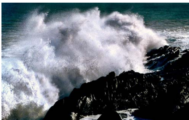
◇ 鲒门——惊涛拍岸（摄于1998年）