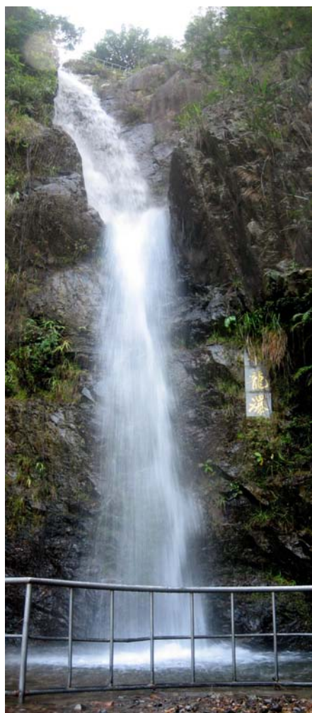
◇ 赤石五龙峰 (摄于 2004 年 6 月)