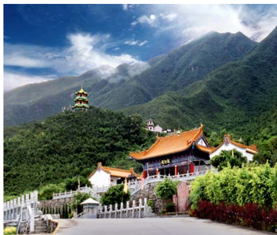
◇ 海丰莲花山——云莲胜境（摄于2003年）