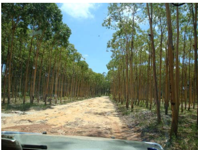
◇ 平东镇速生桉 (摄于 2004 年 7 月)