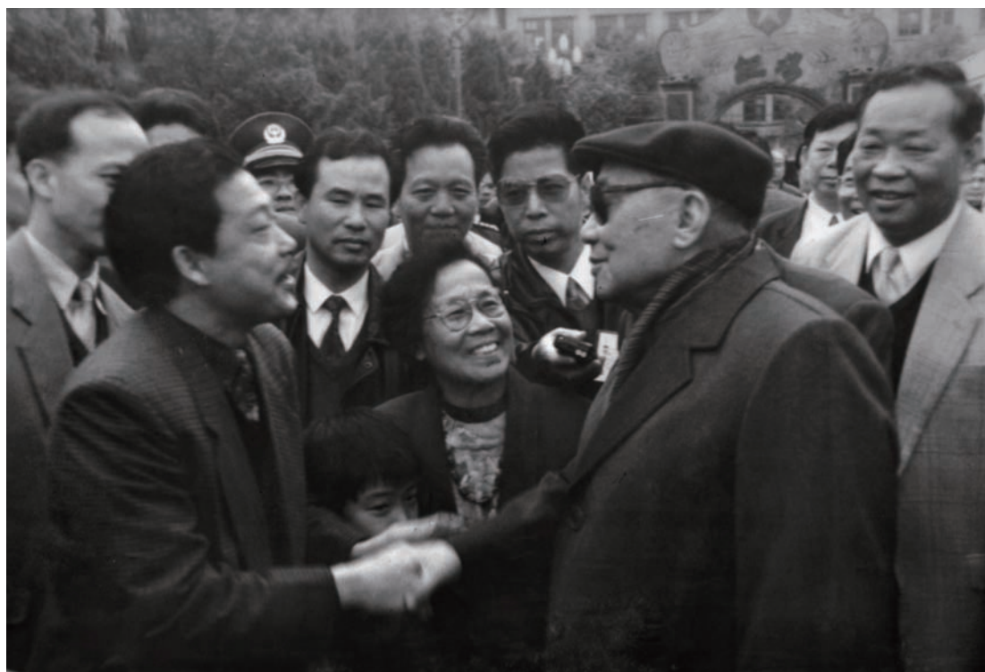
◇ 1996年1月29日，原国家主席杨尚昆（前排右一）在红场接见彭湃烈士亲属。