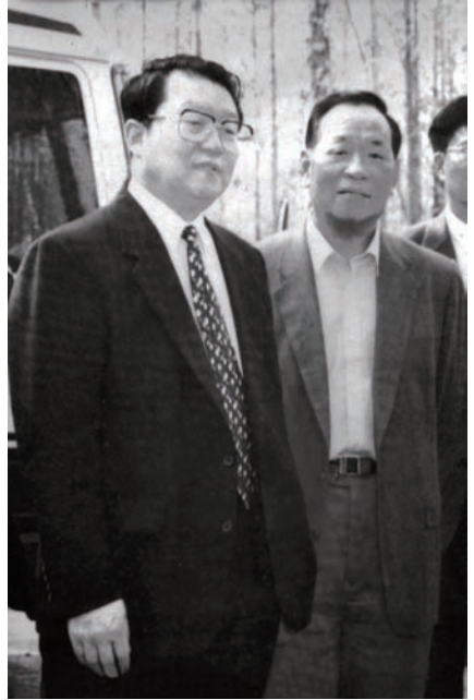
◇ 2001年9月4日，中共中央政治局委员、广东省委书记李长春（左一）由中共海丰县委书记罗校陪同考察海丰。