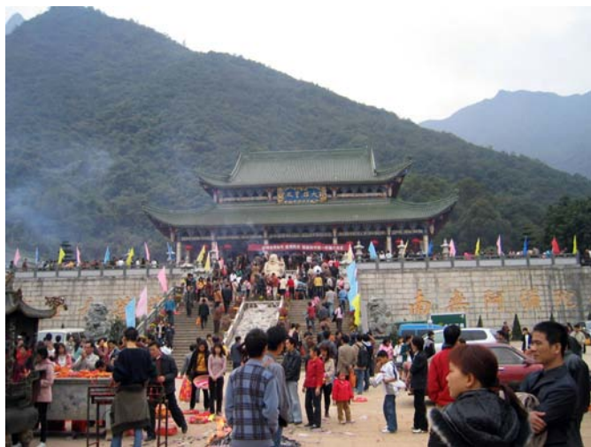
◇ 莲花山鸡鸣寺 (摄于 2004 年 10 月)