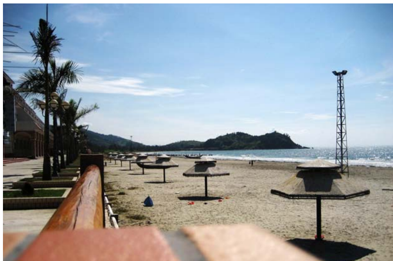
◇ 小漠南方澳度假村 (摄于 2003 年 9 月)